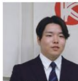
抱負を述べる新入社員

「『三ヶ年テーマの「破壊と創造」の二年目に入る。昨期は色々な事に挑戦しようとしたが、能登半島地震や慢性的な人出不足、仕事量過多で思うように進まなかった。同時に従来のやり方を見直す良い機会となった。今期は更なるブラッシュアップを図るとともに、未来を創造する体制づくり、実際に創る事ではないかなければならない。働きがいを持てる会社づくりの」