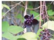
アケビの花。社長宅敷地内。

桜の開花は例年よりも遅かったものの、他の花は早いような気がしました。珍しくアケビや花梨の花がたくさん咲いていました。実も豊作になるかもしれません。四月上旬撮影。