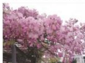
藤の花。弊社本社近くの公園。