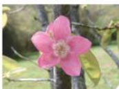
花梨の花。弊社山野工場敷地内。