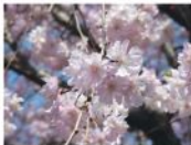
桜の花。社長宅敷地内。